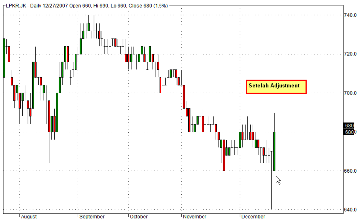
Gambar bawah: Setelah Adjustment