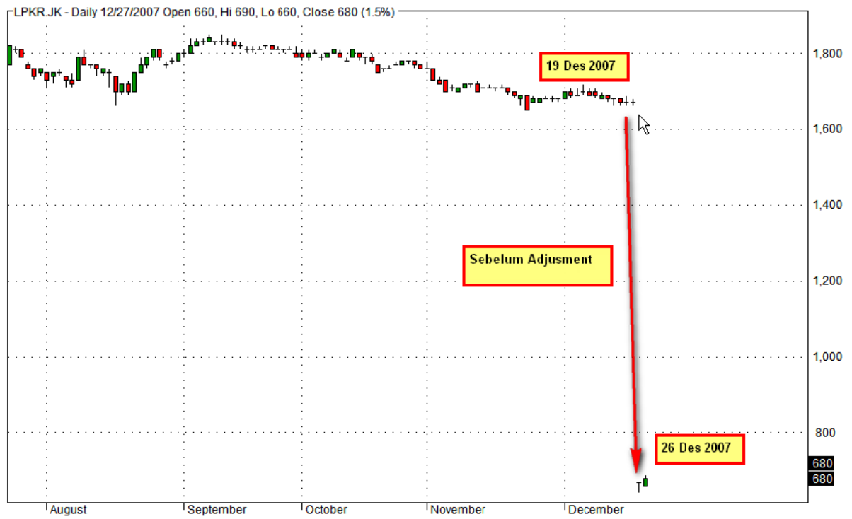
Gambar atas: Sebelum Adjustment